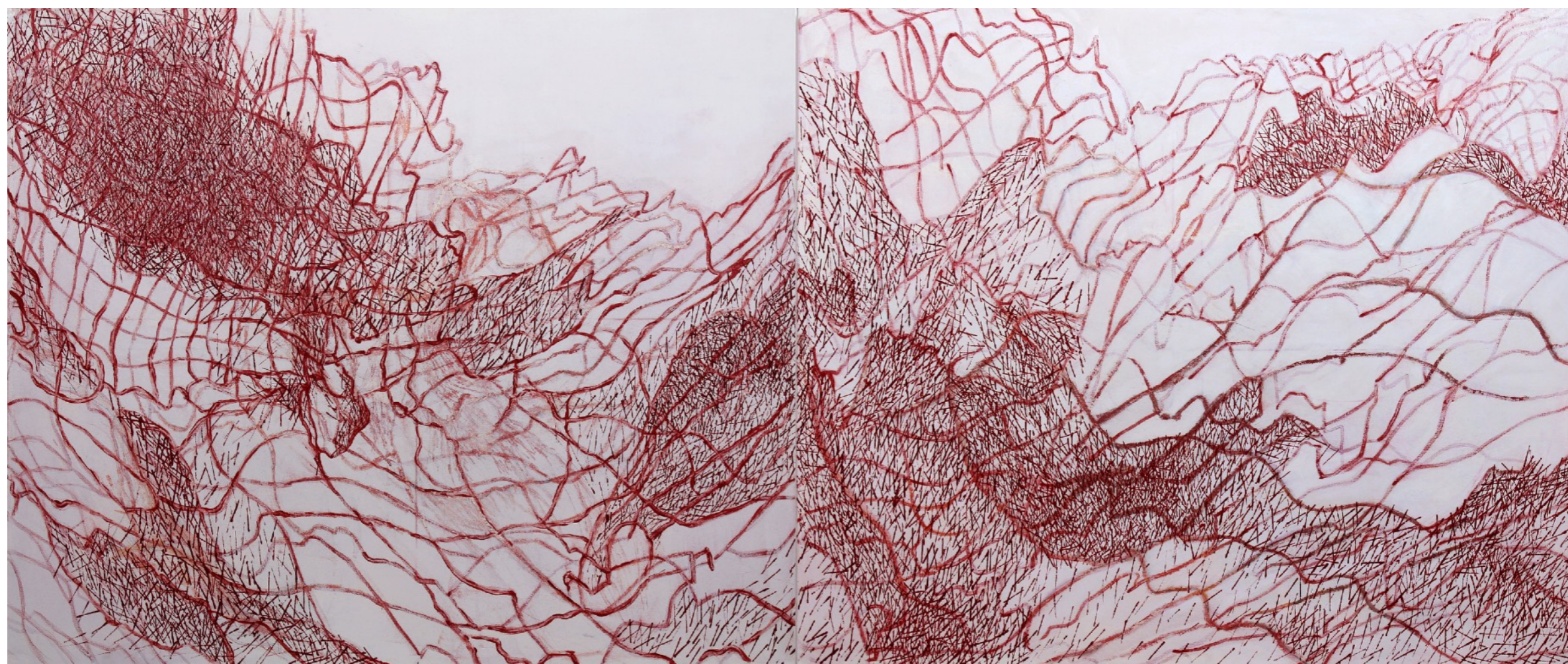
Magmaterreno Rojo VI Óleo sobre tela 100 x 240 cm (díptico), 2024